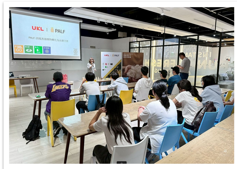
實踐大學講座分享