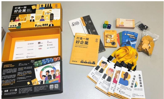
B型企業協會「台灣版 BIA桌遊計畫」贊助