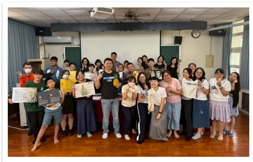
南華國中教師研習講座分享