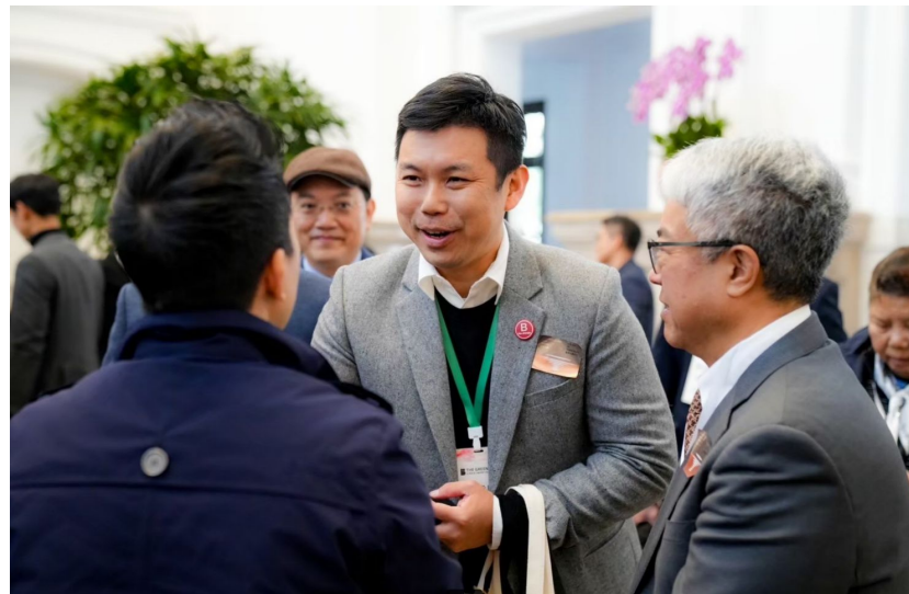
與好事交易所 (TGB) 團隊一同赴總統府參訪拜會