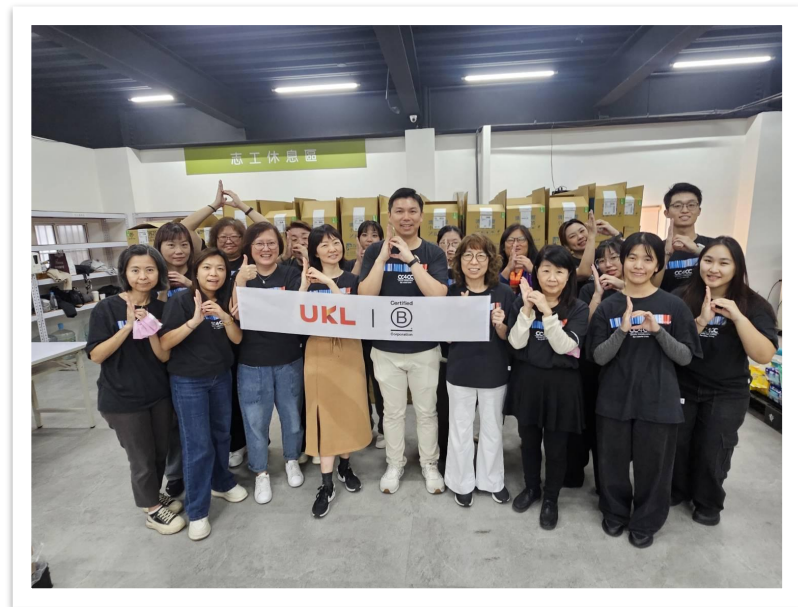
參與安德烈慈善協會食物銀行志工服務