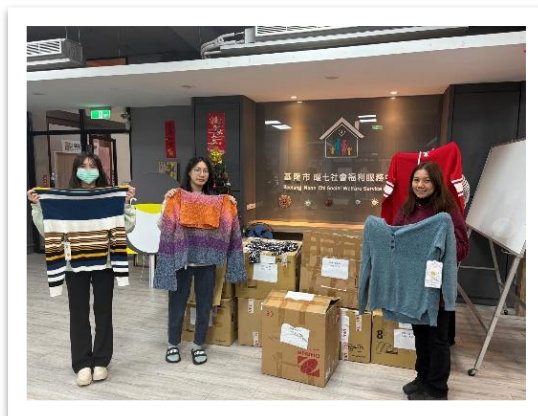
基隆市社會福利服務中心 (捐贈300件毛衣)