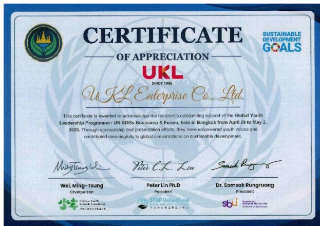
支持青年參與聯合國 SDGs曼谷論壇