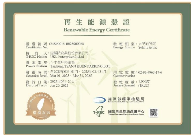
2025持續購買綠電並取得憑證