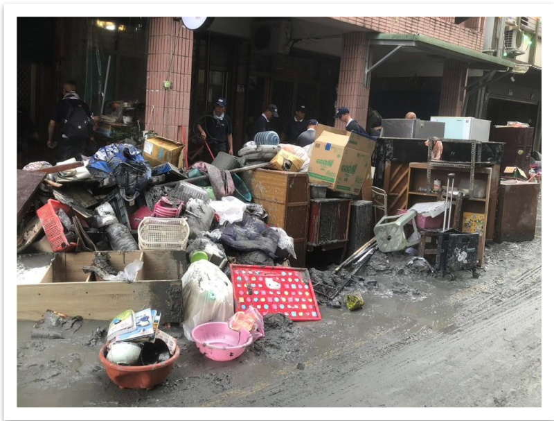
支持員工參與花蓮光復鄉救災志工服務