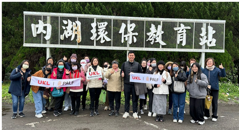
參與慈濟環保教育站志工服務