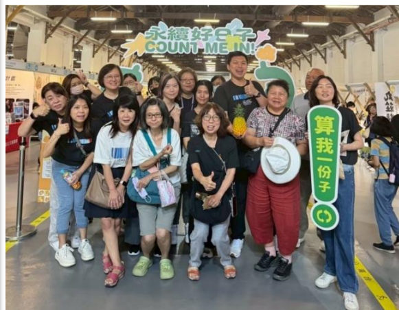
全公司參與「2025永續好日子」活動 推廣健康與永續生活方式