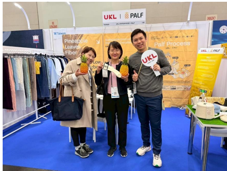
2025 波特蘭 FFF 功能性面料展 ( 舊金山經濟代表處組長來訪 )