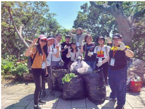
參與2025北市大地企業 ESG 圓山風景區外來種移除活動 (清理總重量：90公斤小花蔓澤蘭)