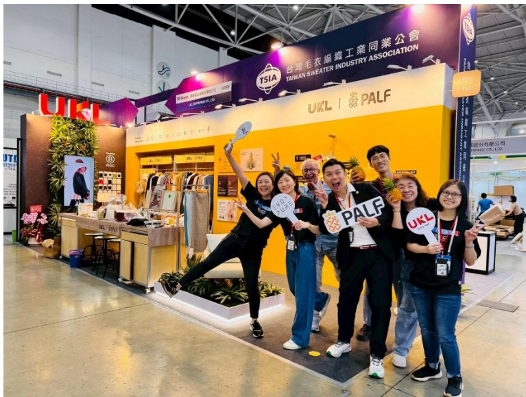
2025 台北紡織展 ( TITAS )