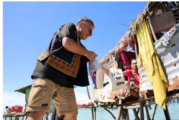
亞洲綜合原住民社區行動組織 帆布袋贊助