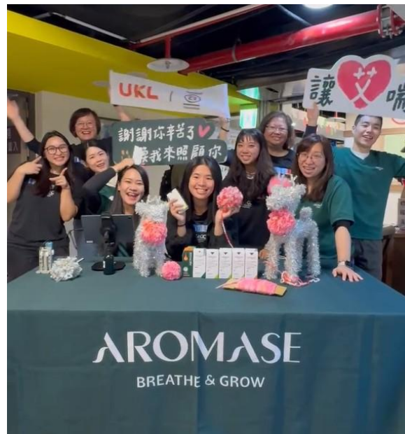
連續三年參與艾喘息照顧者聯盟， 提供新北家協照護者「廢棄毛線 DIY」活動 服務人數 | 約30位照顧者