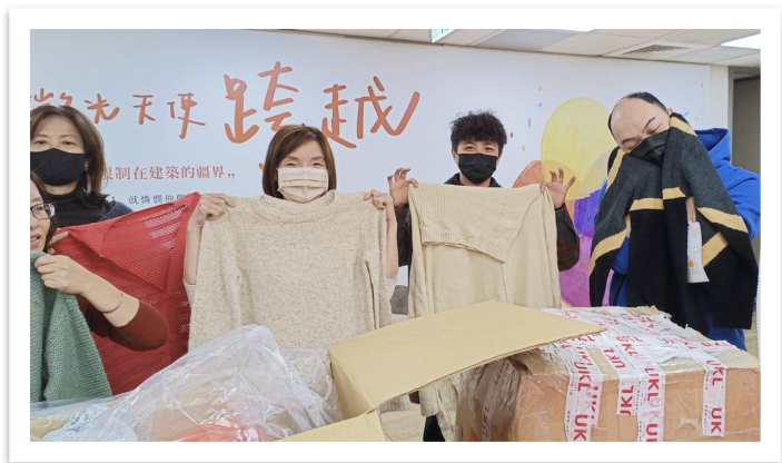
OIKOS社區關懷協會 (捐贈300件毛衣)