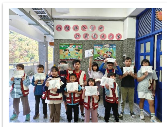
花蓮偏鄉三間國小防護衣捐贈 (麒麟國小、紅葉國小、發祥國小)