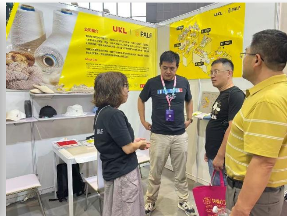
2025 Yarn Expo秋季紗線展